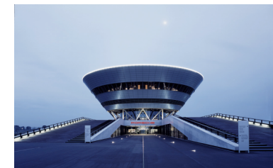
Kundenzentrum des Porsche Werkes Leipzig

Mittwoch, 30. November 2005 Beginn: 14.00 Uhr