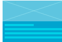
Textbereich mit Kategorie- überschrift und 3x3 Zeilen à 100 Zeichen (rotierend)